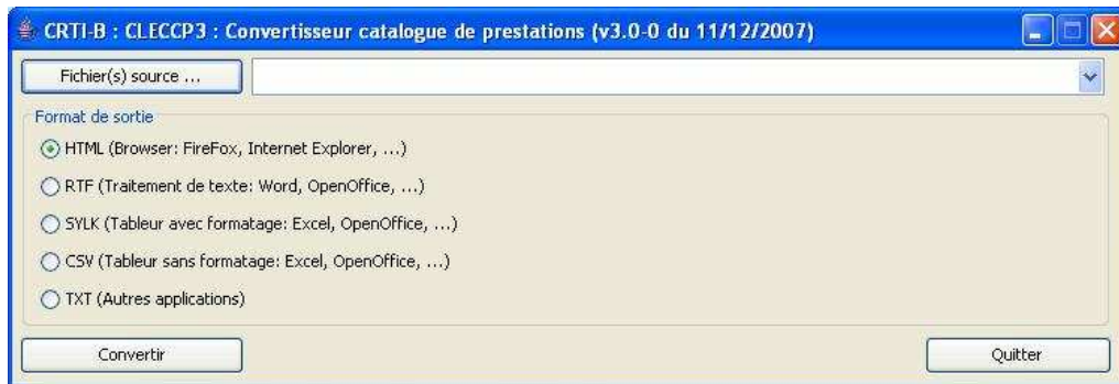
écran principal du convertisseur CLEC-CP

Afin de générer les formats rtf, csv, sylk, txt et html à partir du fichier xml, le CRTI-B met à disposition un convertisseur de lecture de catalogue de prestations ("CLEC-CP") très facile à utiliser. Ce convertisseur peut être téléchargé sur www.crtib.lu , rubrique 'Convertisseurs' ou obtenu gratuitement sur CD-Rom sur simple demande au CRTI-B.